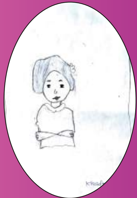
KHADEEJA 5 B