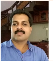
മൊയ്തീൻകുട്ടി. പി HST മലയാളം