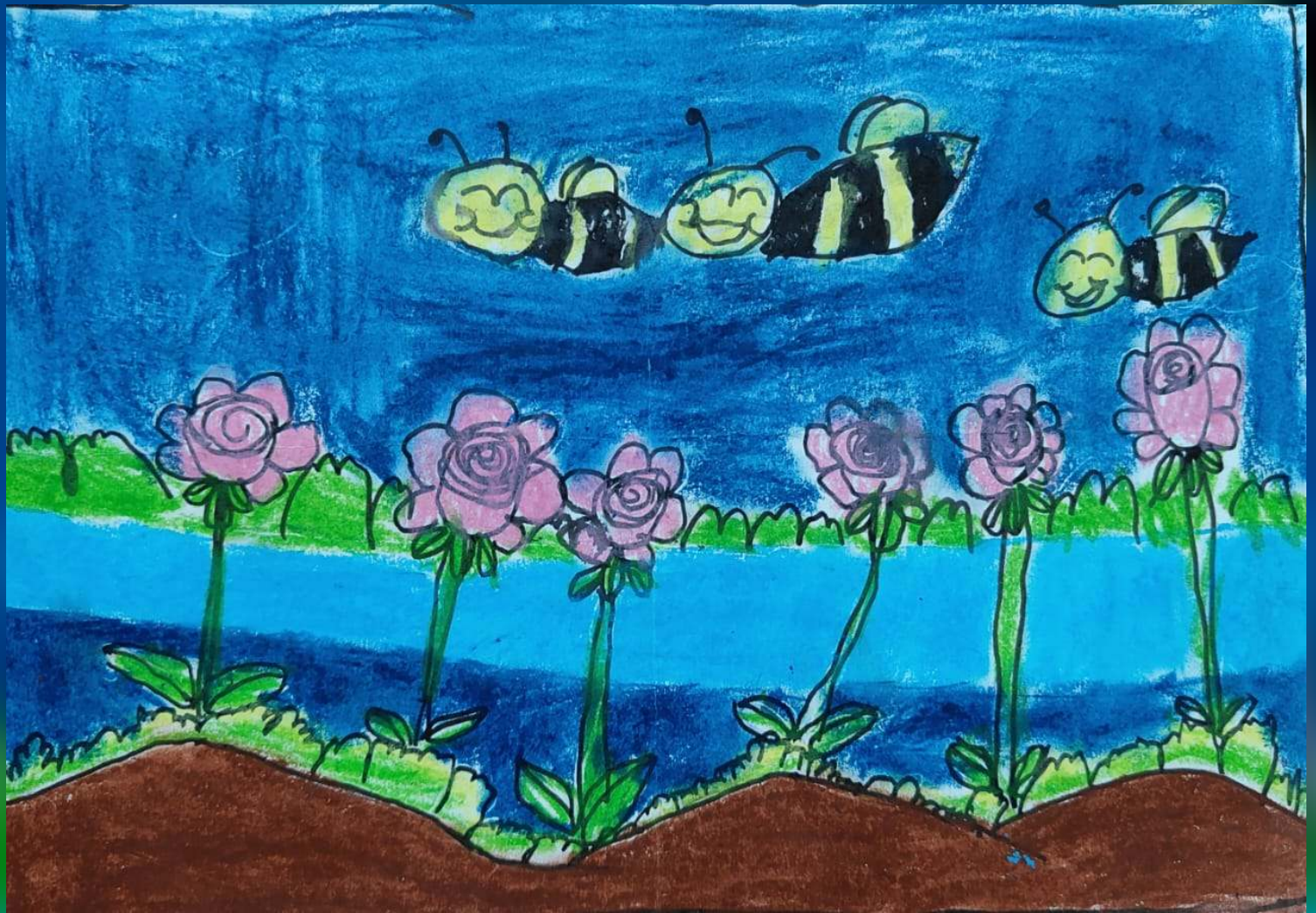
Faya Zainab III A