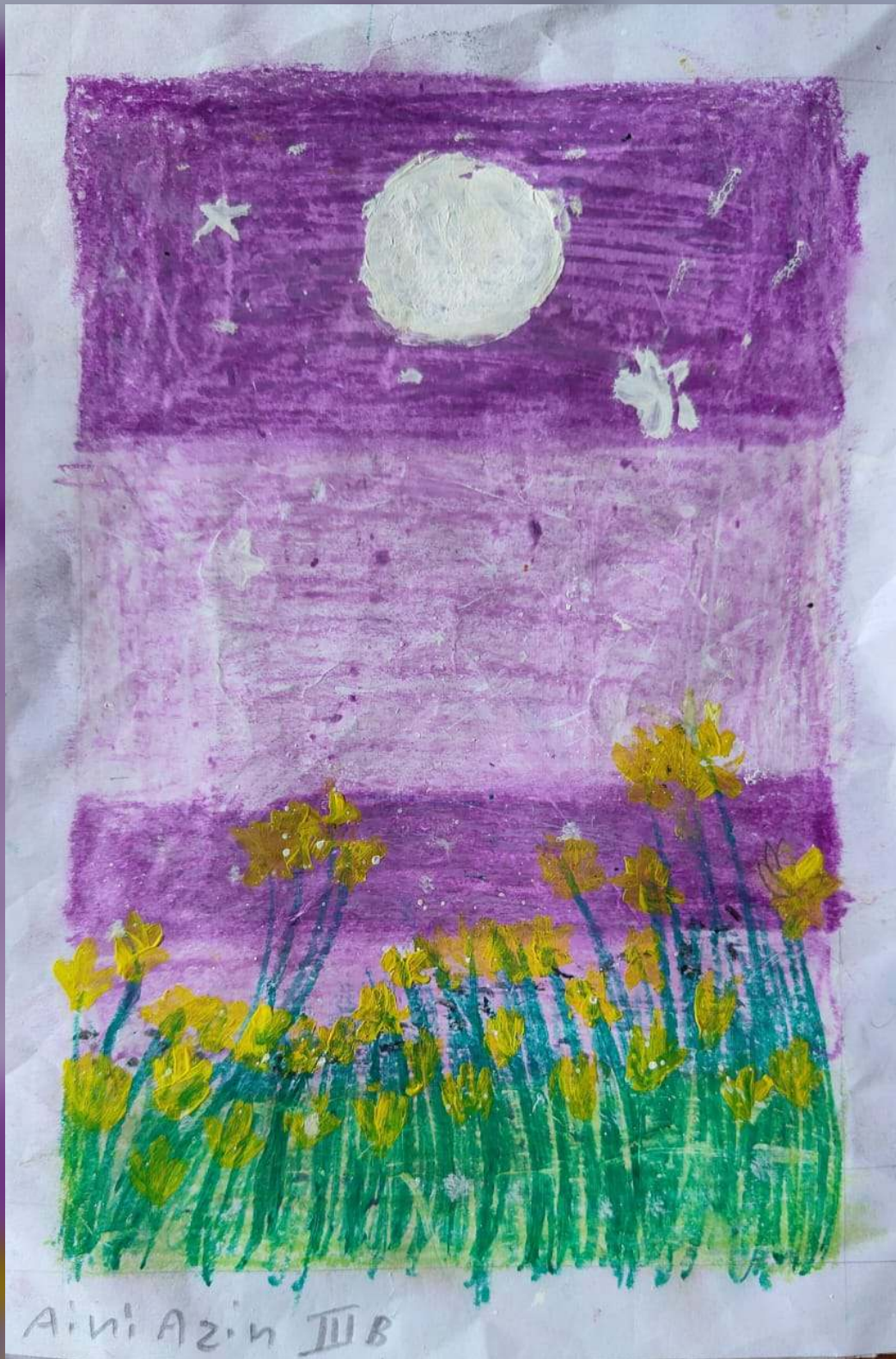
Aini Azin III B