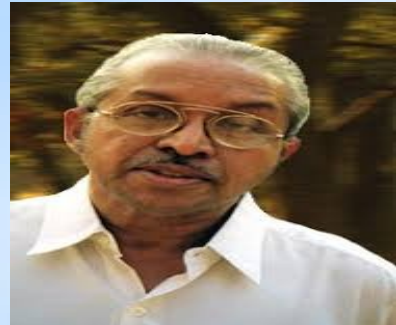
ഒ എൻ വി കുറിപ്പ്