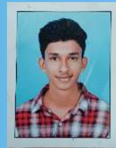
KAILAS S 9C

IF YOU WANT TO SHINE LIKE A SUN FIRST BURN LIKE A SUN