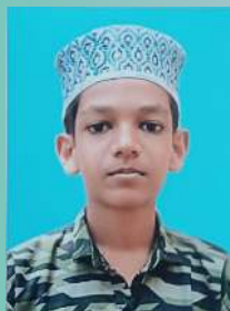
AL Ameen N