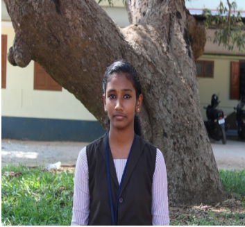
ATHULYA PRAKASHAN 8B