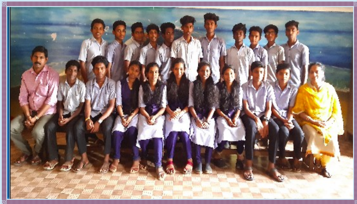
LITTLEKITES BATCH 2018-2020