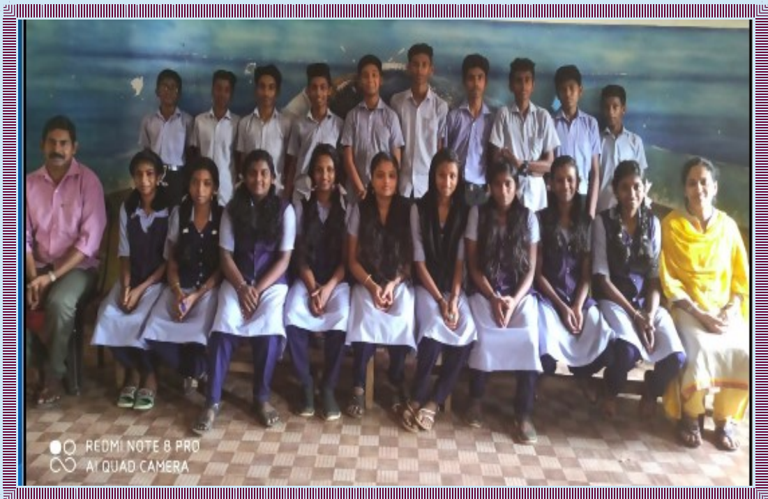
LITTLE KITES BATCH 2019-2021