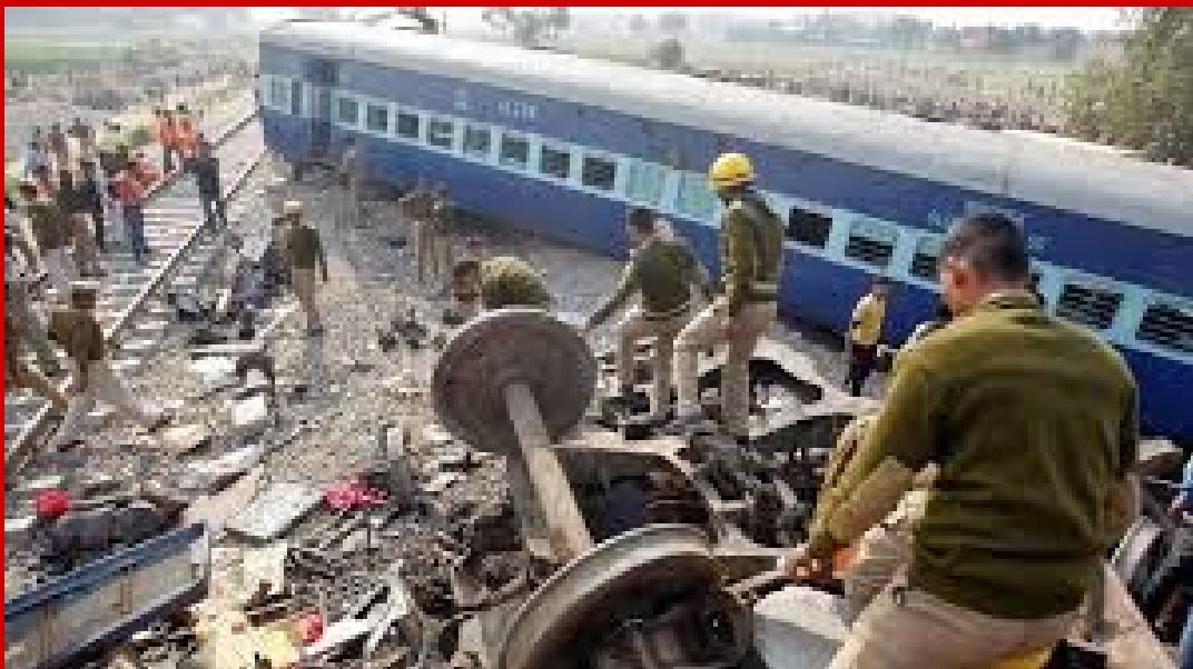
അങ്ങനെ അയാൾ ഒരു സ്വപ്നം കണ്ടു

പതിവുപോലെ അയാൾ മാനം മുട്ടെ സ്വപ്നം കണ്ട് കിടന്നുറങ്ങി. ചന്ദ്രിക വഴക്കു പറയാൻ തുടങ്ങി തുടർന്നു അയാൾ കുളക്കരയിൽ നിന്ന് വരുന്നതാണ് ചന്ദ്രിക കണ്ടത്. ഉടുപ്പു മാറ്റി അയാൾ യാത്രയായി. അദ്ദേഹത്തിന്റെ ഏക മകൾ കളിക്കുന്നതും കണ്ടാണ് അയാൾ പോയത്. റെയിൽവേ പാത ശരിയാക്കുന്ന ഒരു കഴിമടിയനുമാണ് അയാൾ. നേരം സന്ധ്യയായി. അയാൾ മടങ്ങി. അത്താഴം കഴിച്ചു. എല്ലാവരും ഉറങ്ങാൻ കിടന്നു.