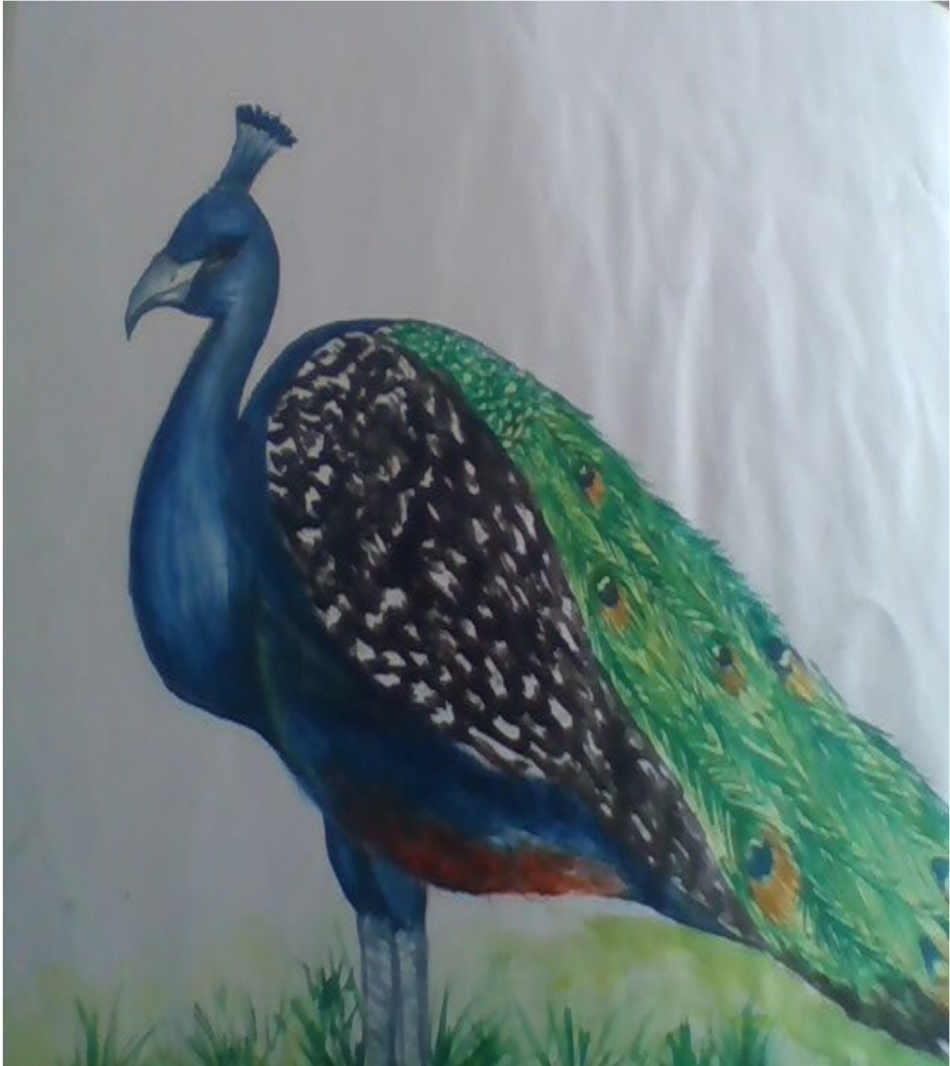
കുട്ടിമാഗസിന് മഴയായി പെയ്തതും മഞ്ഞായി ഉരുകിയതും