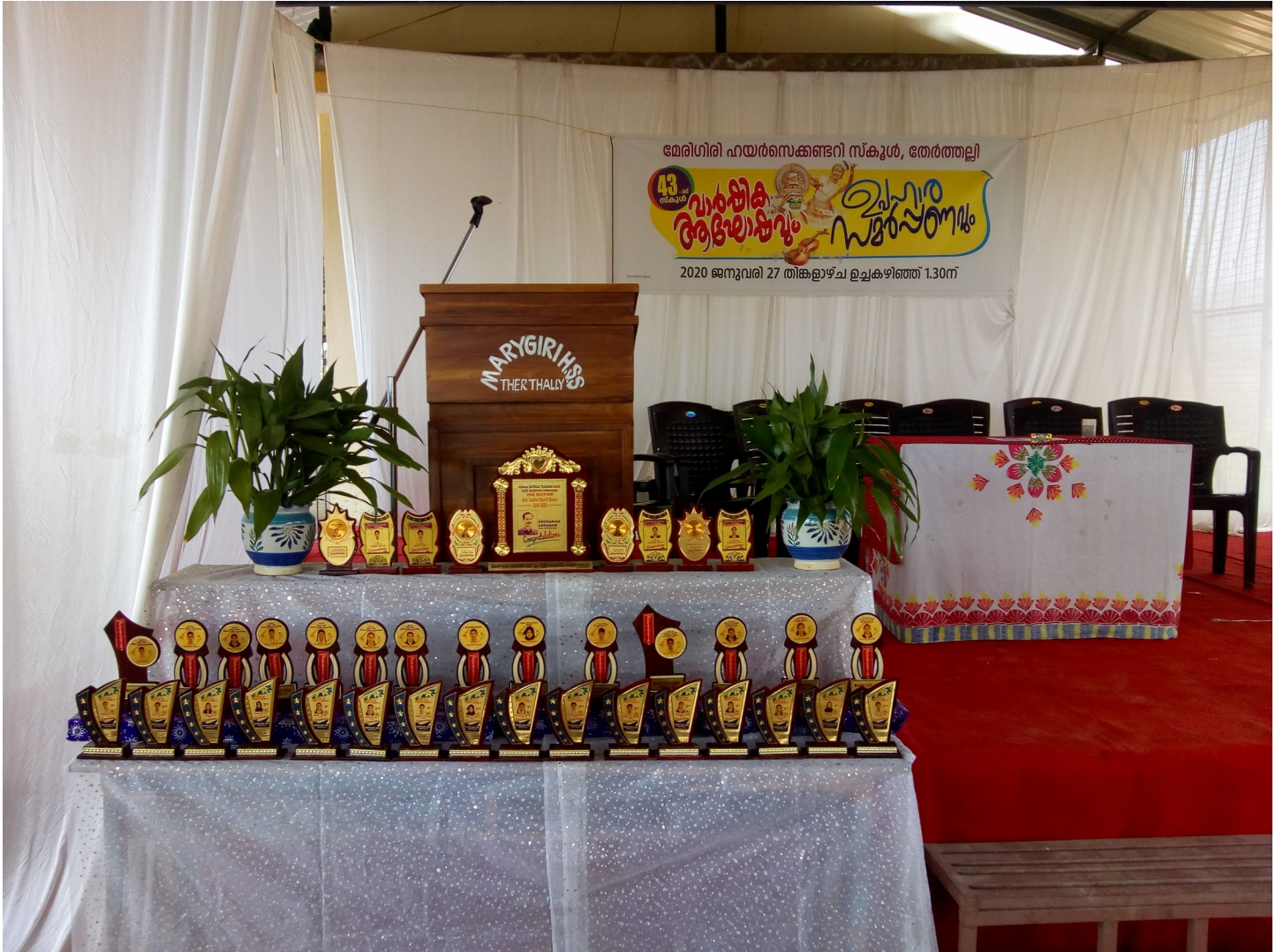
awards and trophy