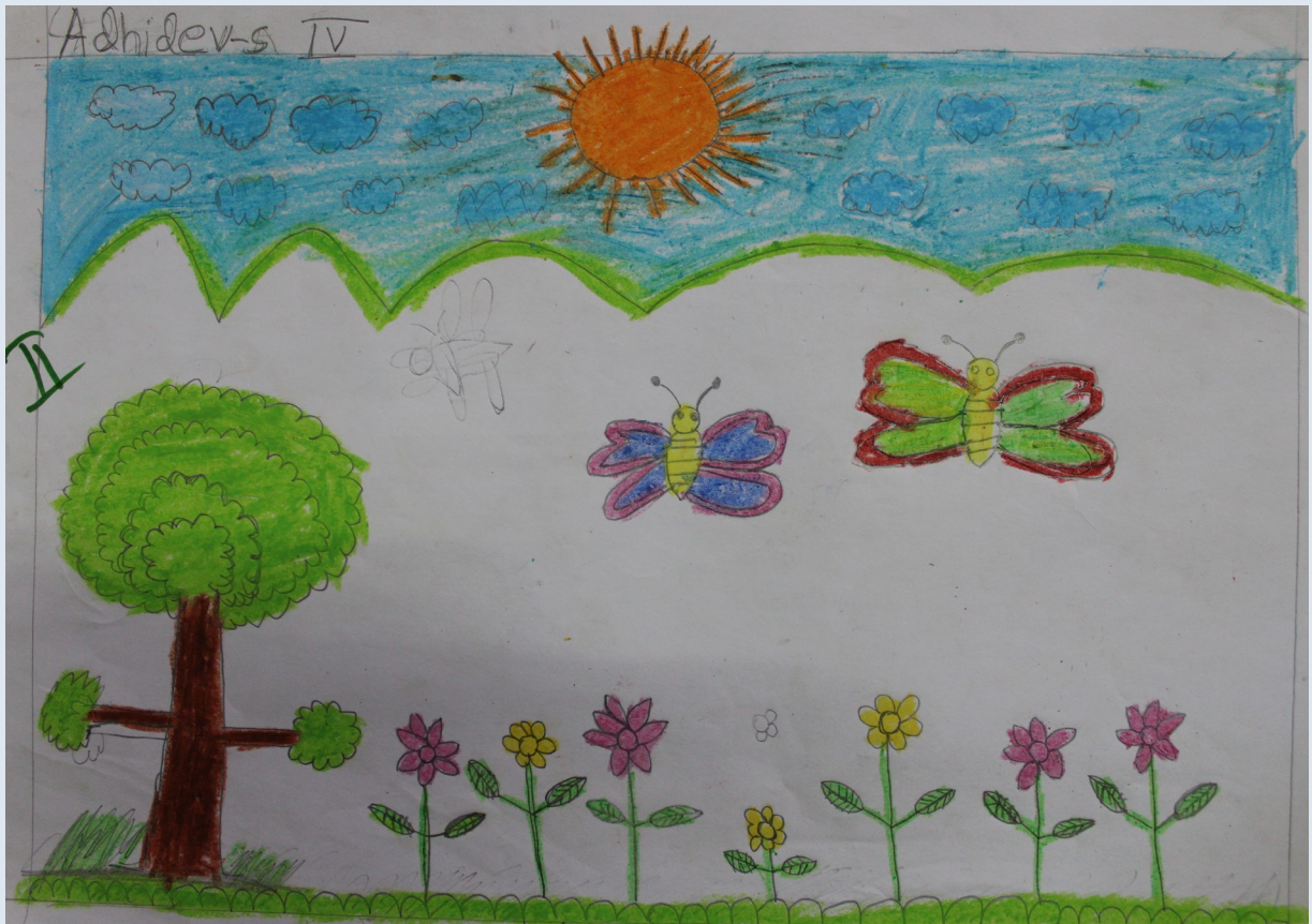
ആദിദേവ്.എസ് നാലാം തരം