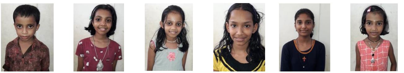
ഭവദജ് നൈതിക ആർ ശ്രീയാലക്ഷ്മി: ജീവനപ്രിയ ദിയാപ്രജിത് നിരഞ്ജന മാനസ