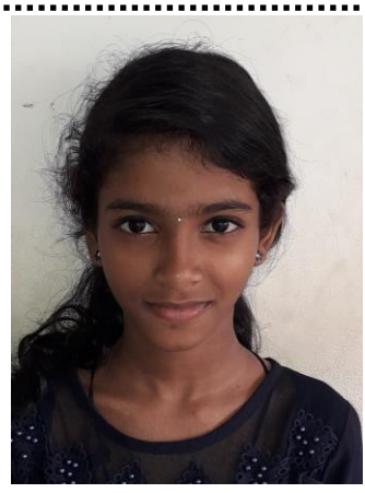
അനൈന.ജെ KSTF രാജ്യസ്തര ചിത്ര രചനാ സ്വർധായാം യു.പി വിഭാഗേ പ്രഥമ സ്ഥാനം