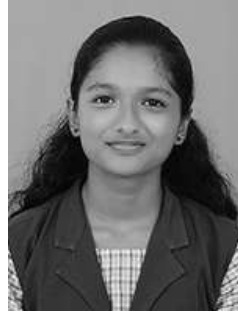
അമേഷി വി 10 ബി