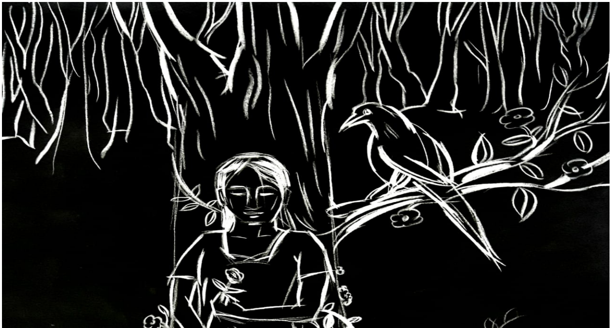
vijesh u v