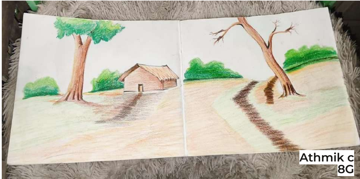
Athmik c 8G

ഒരു വശത്ത് നിറഞ്ഞ മരം വീടിന് മുകളിൽ പച്ചക്കൂട വിരിക്കുന്നു. മറുവശത്ത് ഉണങ്ങിയ വേരുകൾ ആകാശത്തോട് കഥ പറയുന്നു.