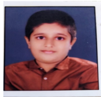
ഡോൺ ജോബി IXB

കൊതിയനായ ഒരു ഉറുമ്പായിരുന്നു കിട്ടൻ.ഒരു ദിവസം കിട്ടൻ ഒരു വലിയ കേക്കുകുപ്പണം കിട്ടി.ആർക്കും കൊടുക്കാതെ മുഴുവൻ തിന്നണം.അവൻ അത് മാളത്തിലേയ്ക്ക് കൊണ്ടു പോകാൻ നോക്കി.