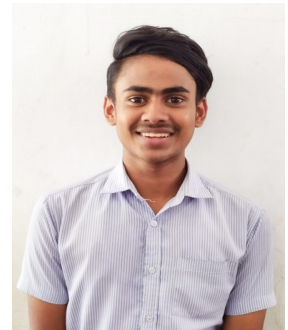
ഉമർ IX B

പാടും പുഴകളും തോടും- മോടി കൂടും മലരണിക്കാടും നീളേ കളകളും പാടും- കാട്ടും- ചോലയുമാമണിമേടും വെള്ളിയരഞ്ഞാണപോലേ- ചുറ്റും തുളളിക്കളിക്കും കടലും കായലും നീലമലയും- നീളേ കോരിത്തരിക്കും വയലും പീലിനിവർത്തിനിന്നാടും- കൊച്ചു കേരമരതകത്തോപ്പും നീളേ കുളിരൊളി തിക്കീ- എപേ കേരളമെത്രയോ ഭംഗീ