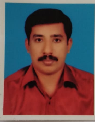
Shihayas. S (Kite Master)