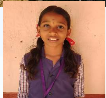
വൈഗ എസ്സ്.ആർ 5.B