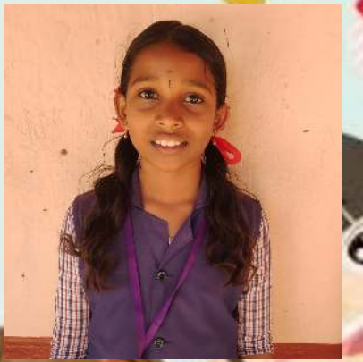
വൈഗ എസ്സ്.ആർ 5.B