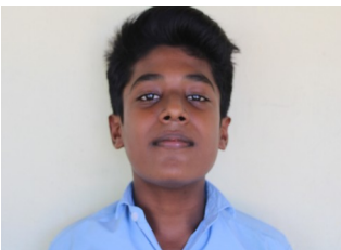
FAVAS V SUBAIR

പമ്പ കടന്നു പറന്നോരുറുമ്പൊരു ചെമ്പകക്കൊമ്പിന്റെ തുമ്പിലെത്തി!