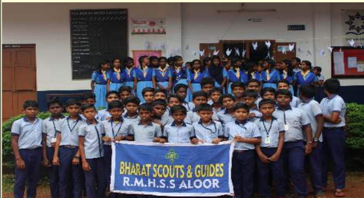
സൂര്യ തല ഐടി മേള