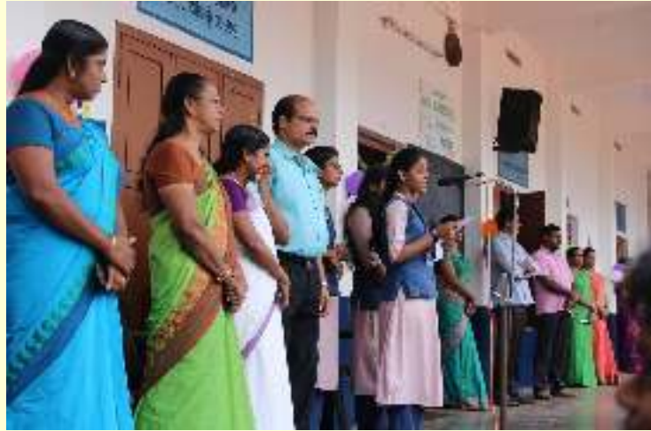
പ്രവേശനോത്സവം 2019 ജൂൺ