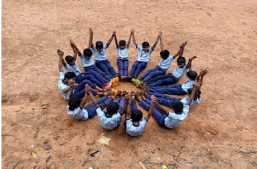
ഹലോ ഇംഗ്ലീഷ് പ്രവർത്തനം