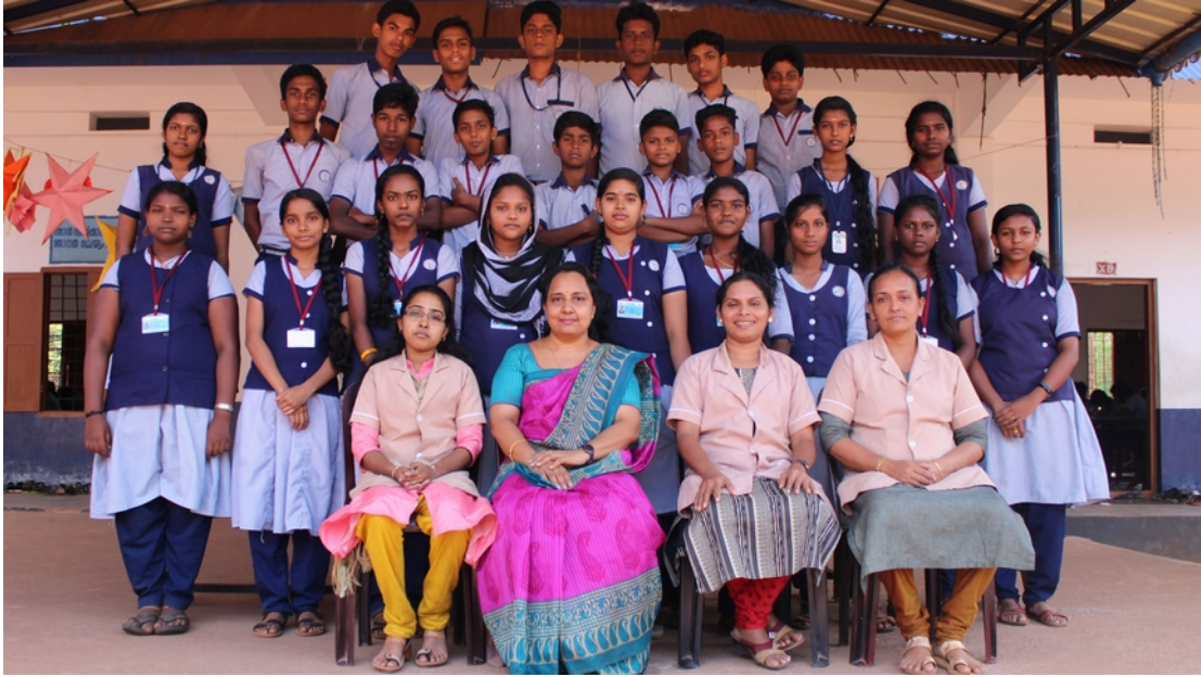
2018-19 അധ്യയന വർഷത്തിലെ ഞങ്ങളുടെ പ്രിയപ്പെട്ട ലിറ്റിൽ കൈറ്റ്സിനൊപ്പം