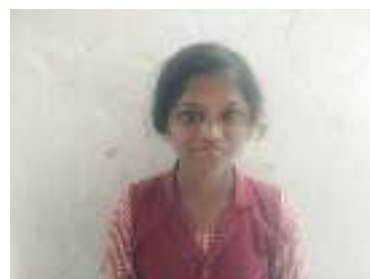
(9 - C)