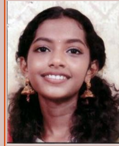
VARADA M 9R