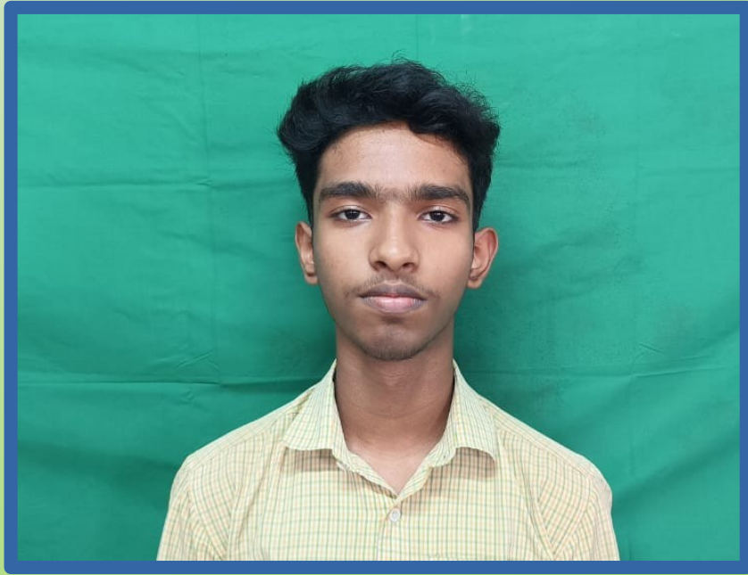
AHAN M K 9 K