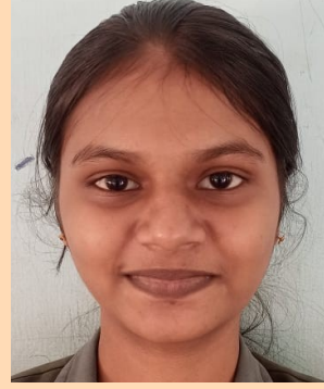
அவனிஜா அப் 10 ம்