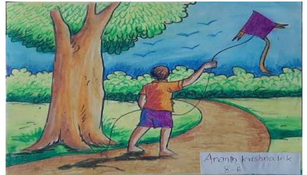
Ananth krishna k k 8-E