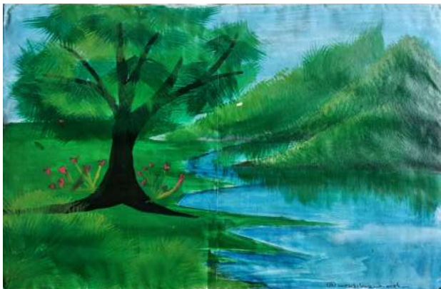
Fathima Farhana 9c