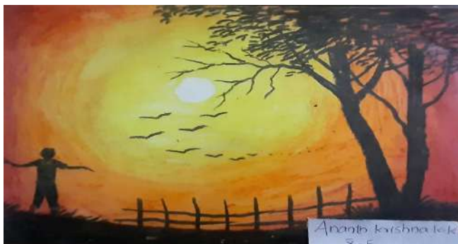
Ananth krishna k k 8-E