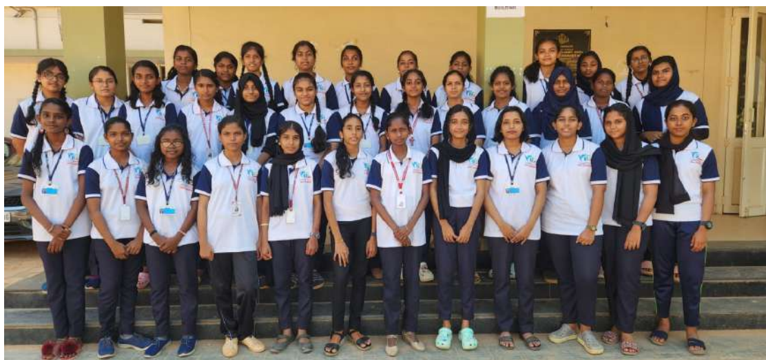
ലിറ്റിൽ കൈറ്റ്സ് 2021-24 ബാച്ച് -1