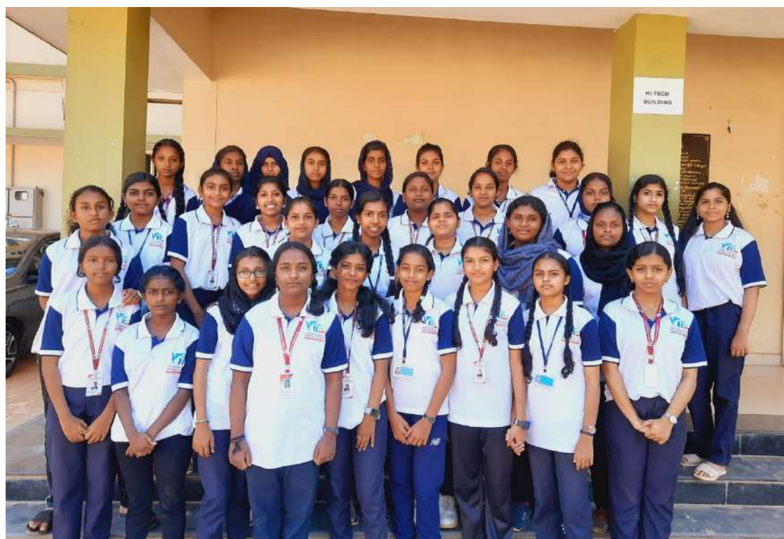
ലിറ്റിൽ കൈറ്റ്സ് 2021-24 ബാച്ച് -2