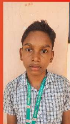
VARUN R 8B

"AI" അല്ലെങ്കിൽ "ആർടിഫിഷ്യൽ ഇൻ്റലിജൻസ്" എന്നത് മാറ്റി ചേർത്താണ്. ഇത് കമ്പ്യൂട്ടർ സിസ്റ്റങ്ങളെ മനോഭാഷാ പ്രകാരത്തിൽ വീക്ഷിക്കാൻ കഴിയുന്ന വിദ്യയുടെ ഒരു ശാഖയാണ്. ഇത് ഡാറ്റ വിശ്ലേഷണം, ഉപയോഗിക്കാവുന്ന സ്വന്തമായ നിർണ്ണായകാംശങ്ങൾ നിർമ്മിക്കാനുള്ള ക്ഷമത, നടപടികൾ എടുക്കാനുള്ള ക്ഷമത, അക്കാദമിക താരതമ്യം, ഭാഷാ അനുബന്ധങ്ങൾ എന്നിവയാണ് അതിൻ്റെ ഉത്തരവാദിത്വം.