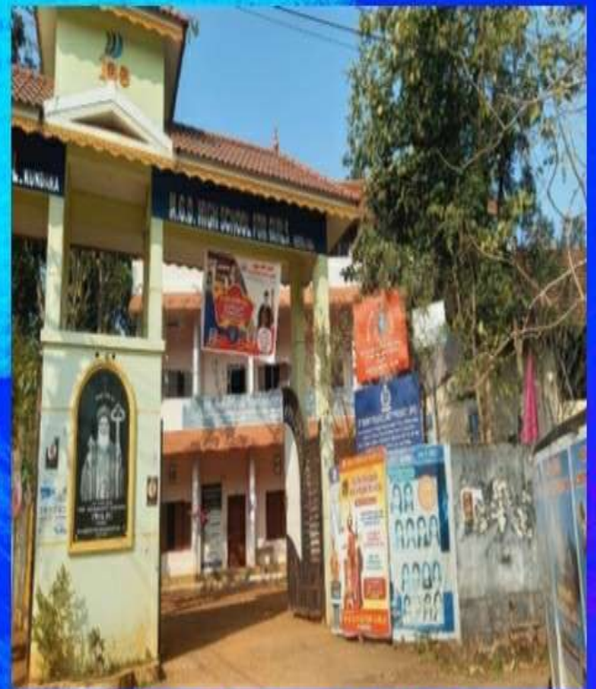
MGD GHS KUNDARA