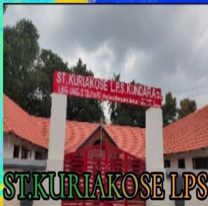
ST. KURIAKOSE LPS KUNDARA