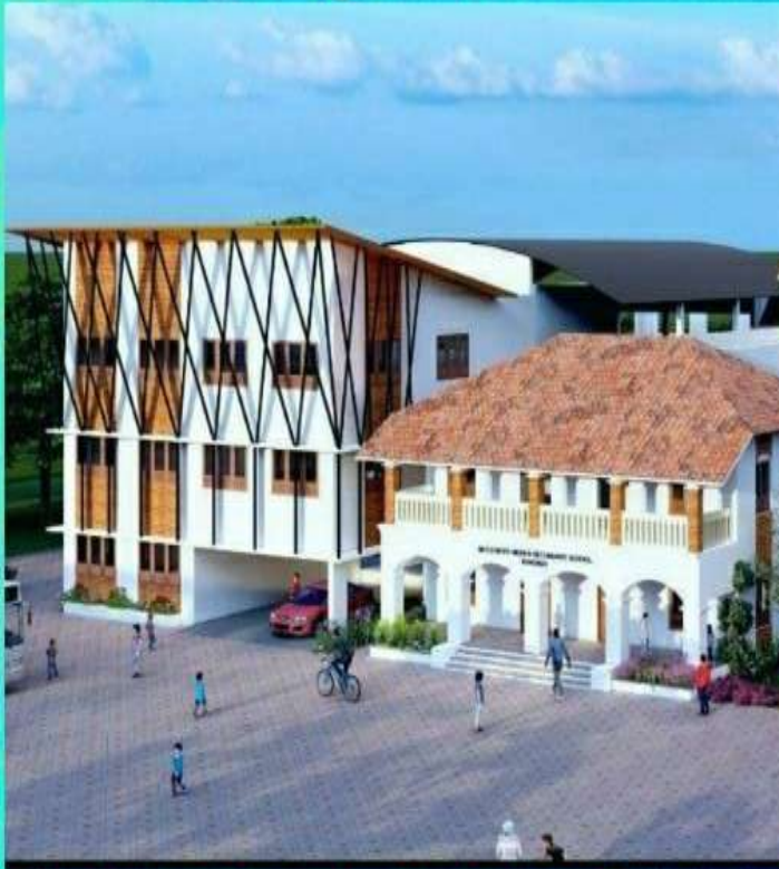
MGD BHSS KUNDARA