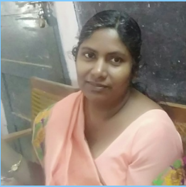
SUMA V. C