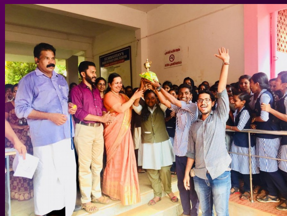
HOUSE BASED CONTEST