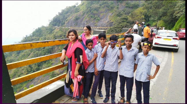
STUDY TOUR ^