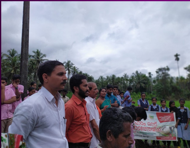
FARMING WITH FARMERS