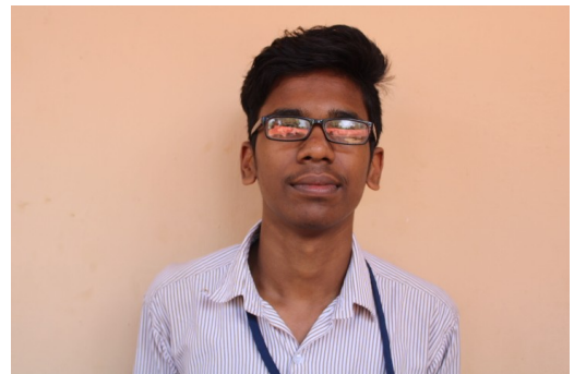
Amal Standard IX C