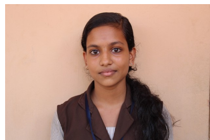
Alka A Standard IX