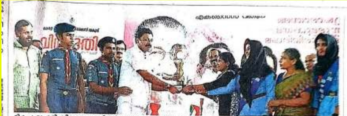
മികച്ച ലഹരി വിരുദ്ധ പ്രവർത്തനങ്ങൾ നടത്തിയ സ്കൂളിനുള്ള സംസ്ഥാനതല പുരസ്കാരം എടത്തനാട്ടുകര ഗവ. ഹയർ സെക്കന്ററി സ്കൂൾ അധികൃതർ മുഖ്യമന്ത്രി പിണറായി വിജയനിൽ നിന്ന് ഏറ്റെടുത്തു.

എസ് എടത്തനാട്ടുകരയ്ക്ക് ലഭിച്ച. മുഖ്യമന്ത്രി പിണറായി വിജയനിൽ നിന്ന് സൂര്യ പ്രതിനിധികൾ തിരുവനന്തപുരത്ത് വെച്ച് അവാർഡ് ഏറ്റെടുത്തി.