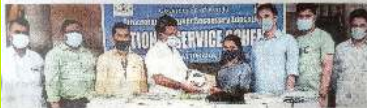
ജീവ സർവ്വകലാശാലയുടെ നേതൃത്വത്തിൽ വാപ്പാവിൽ നിന്ന് എടുത്തു നോട്ടുകൾ ഗവ. ഓറിജനൽ ഹയർ സെക്കന്ററി സ്കൂളിലെ എൻഎസ് എസ് വെള്ളപ്പുഴിൽ ശിവജി നോട്ടു പുസ്തകങ്ങൾ സൂക്ഷിക്കുന്നു.