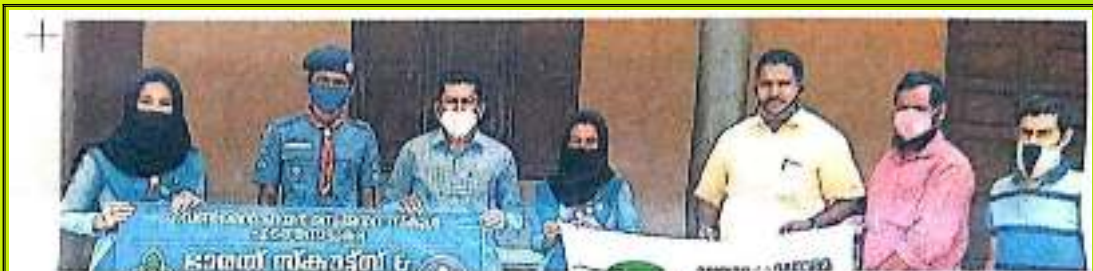
ഏടത്തനാട്ടുകര ഗവ.ഹയർസെക്കൻഡറി സ്കൂളിലെ സ്കൗട്ട്സ് ആൻഡ് ഗൈഡ്സിന്റെ നേതൃത്വത്തിൽ നടത്തിയ മനോരമ നല്ലപാഠം സ്നേഹപ്പടവ പദ്ധതി പദ്ധതിയുടെ ഭാഗമായി ഉദ്ഘാടനം ചെയ്യുന്നു.