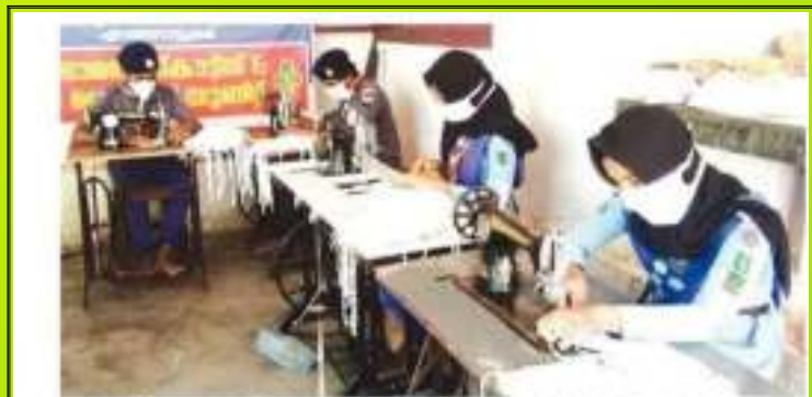
മാസ്ക് നിർമ്മാണത്തിലാഗിയെടുത്ത എടുത്തനാട്ടുകര ഗവണ്മെന്റ് ഹയർ സെക്കന്ററി സ്കൂളിലെ സ്കൗട്ട് വിദ്യാർത്ഥിനികൾ