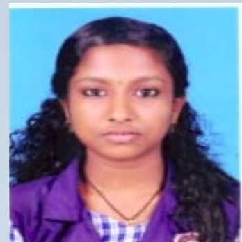
ദേവതീർത്ഥ പി എൻ