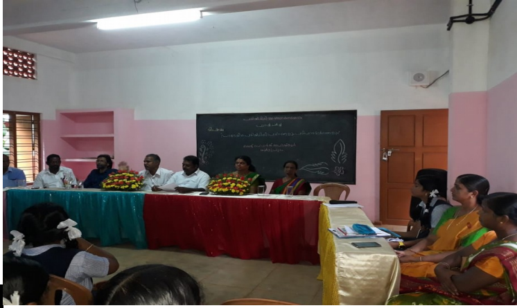
PANEL DISCUSSION ON ENVIRONMENTAL PROBLEMS