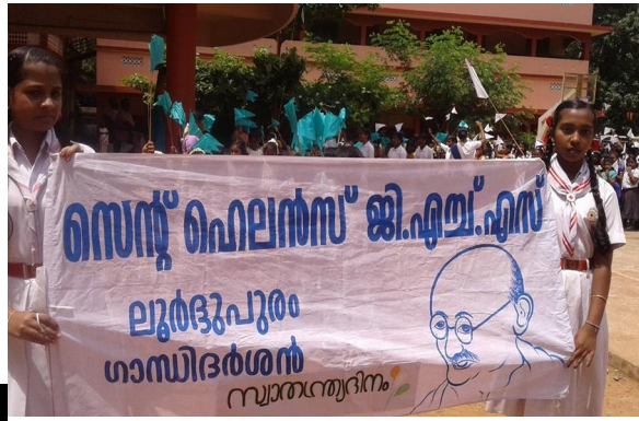
Junior Red Cross