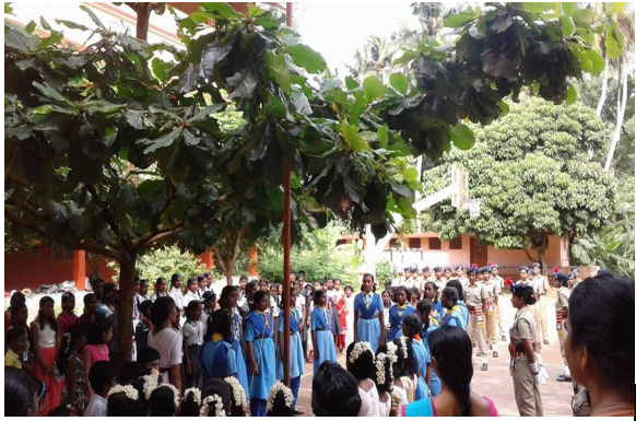
Guide and Scout