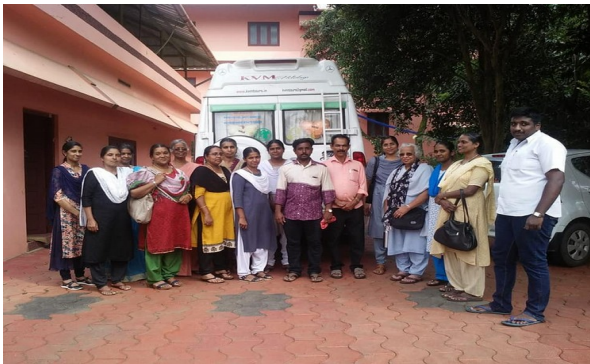
TEAM OF TEACHERS AND HELPERS

എസ്.പി.സി, നല്പ പാഠം, മാതൃഭൂമി സീഡ് ക്ലബ്ബ് ഇവയുടെ ആഭിമുഖ്യത്തിൽ ആവശ്യ വസ്തുക്കളുടെ ശേഖരണം നടന്നു. പ്രളയബാധിത പ്രദേശങ്ങളിൽ ആറു ക്യാമ്പുകളിലായി ആവശ്യ വസ്തുക്കൾ വിതരണം ചെയ്തു.