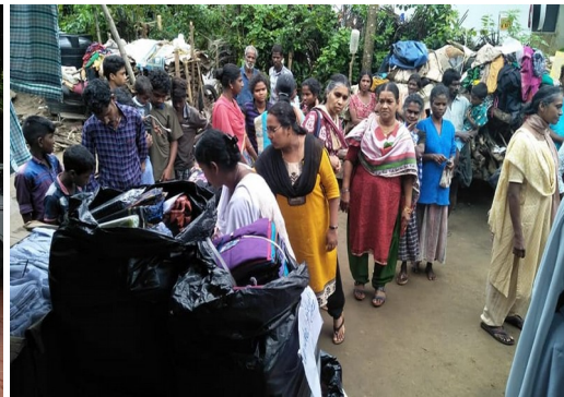
VAYANAD FLOOD AFFECTED TRIBLE AREA