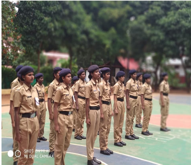
Student police cadet (spc)