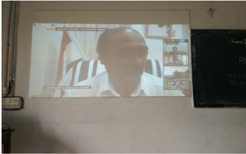
ബഹു. റവന്യൂ വകുപ്പുമന്ത്രി ശ്രീ ഇ. ചന്ദ്രശേഖരൻ ആശംസയർപ്പിച്ചു.