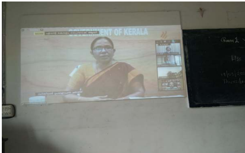
ബഹു. ആരോഗ്യവകുപ്പുമന്ത്രി. ശ്രീമതി. കെ കെ.ശൈലജ ആശംസയർപ്പിച്ചു.