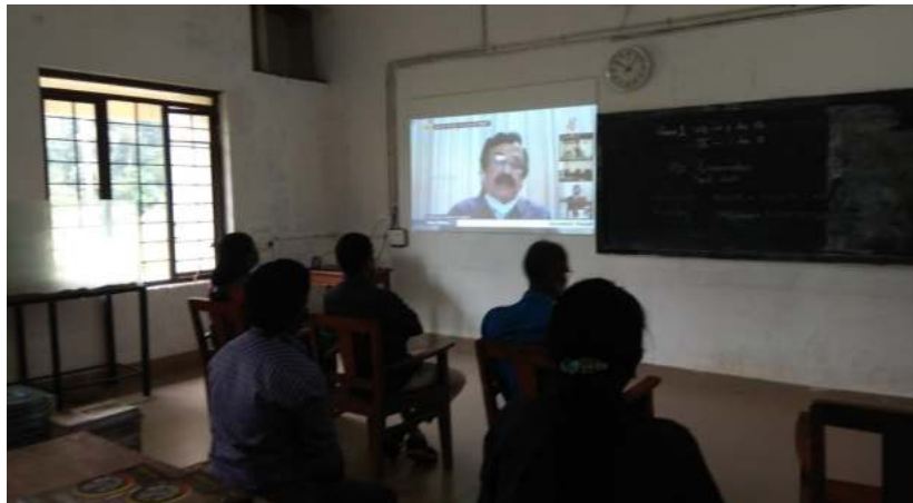
ബഹു.വിദ്യാഭ്യാസമന്ത്രി ശ്രീ. പ്രൊ. വി രവീന്ദ്രനാഥ് അദ്ധ്യക്ഷനായി