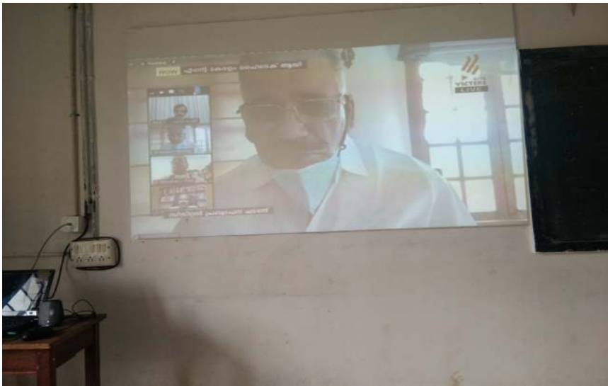
ബഹു. ഗതാഗത വകുപ്പു മന്ത്രി ശ്രീ. എ.കെ.ശശീന്ദ്രൻ ആശംസയർപ്പിച്ചു.