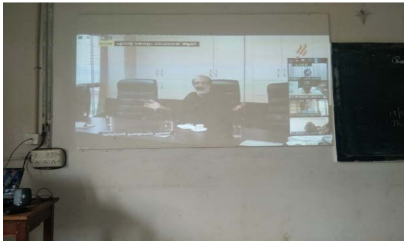
ബഹു. ധനമന്ത്രി ശ്രീ രോമസ് ഐസക് മുഖ്യപ്രഭാഷണം നടത്തി.