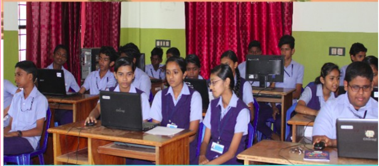
കേരള സർക്കാർ വിദ്യാഭ്യാസ സെക്ഷൻ