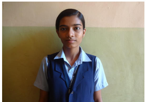
സെന്റ് തോമസ് എച്ച്. എസ്. എസ് തോമാപുരം