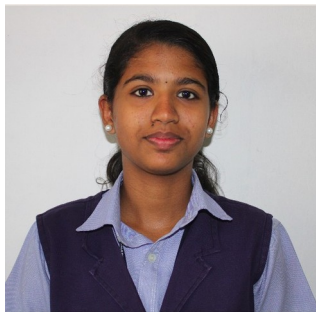
ദിൽഷ ബിജി മെറ്റൽ എൻഗ്രേവിംഗ്