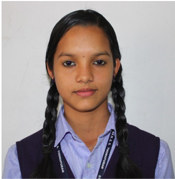
ആൽഫിയ ബിജി ന്യൂട്രീഷ്യസ് ഫുഡ്