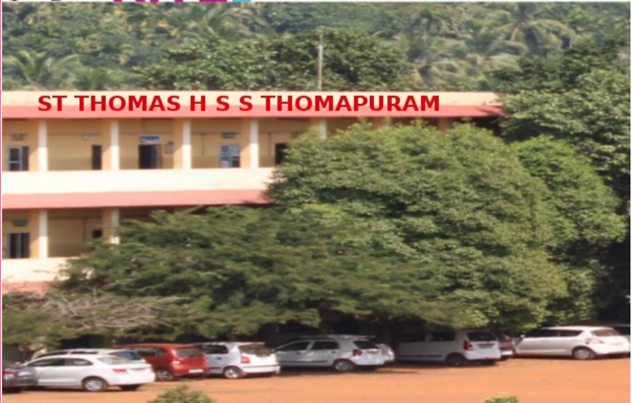
ST THOMAS H S S THOMAPURAM