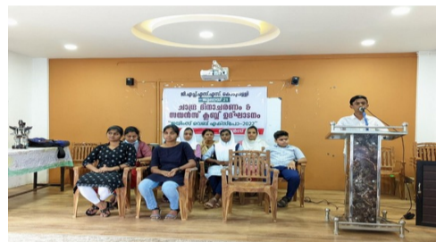
സയൻസ് ക്ലബ്ബ്, ചന്ദ്രദിനാചരണം ഉദ്ഘാടനം വിദ്യാർത്ഥികൾ സംഘടകരായി