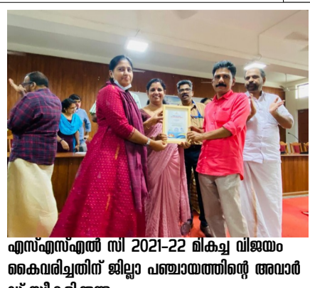
എസ്.എസ്.എൽ സി 2021-22 മികച്ച വിജയം കൈവരിച്ചതിന് ജില്ലാ പഞ്ചായത്തിന്റെ അവാർഡ് സ്വീകരിക്കുന്നു.