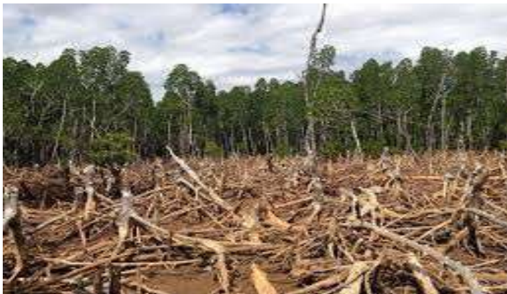
എൽ എഫ് സി എച്ച് എസ് ഇരിങ്ങാലക്കുട