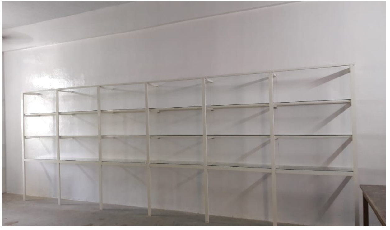
New library in progress