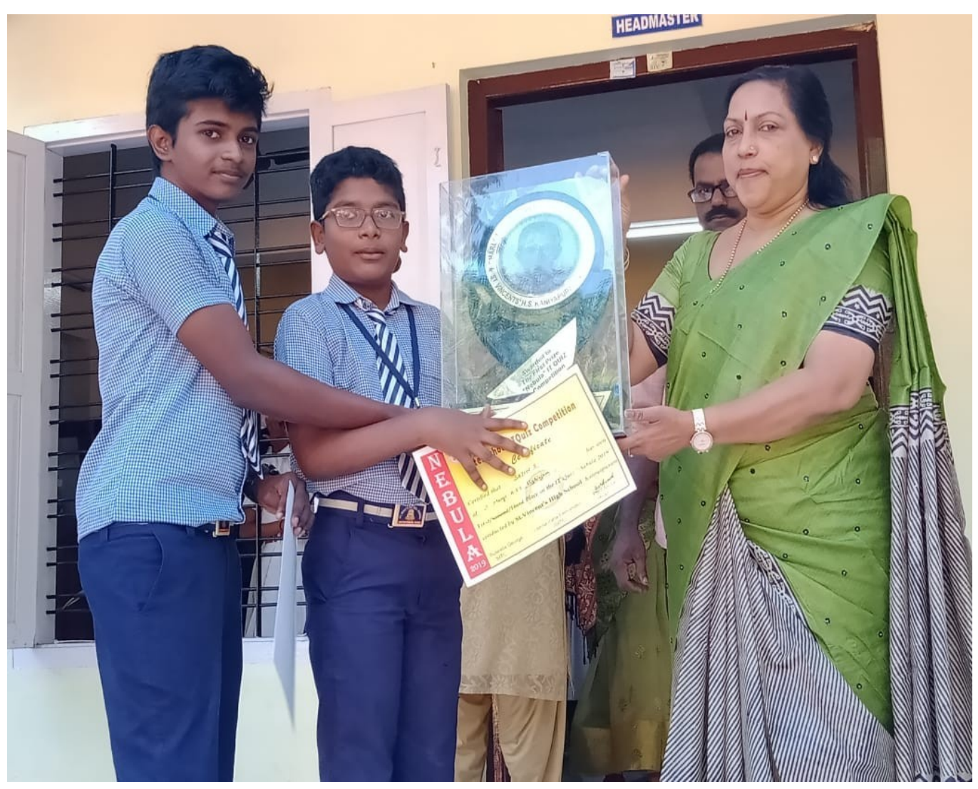
WON EVE-ROLLING TROPHY AND 5000r cash prize