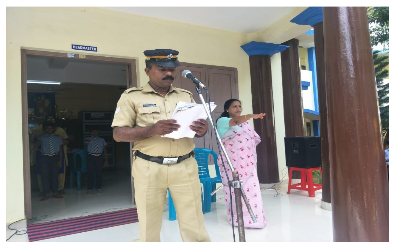
WORLD Tobacco free day speech