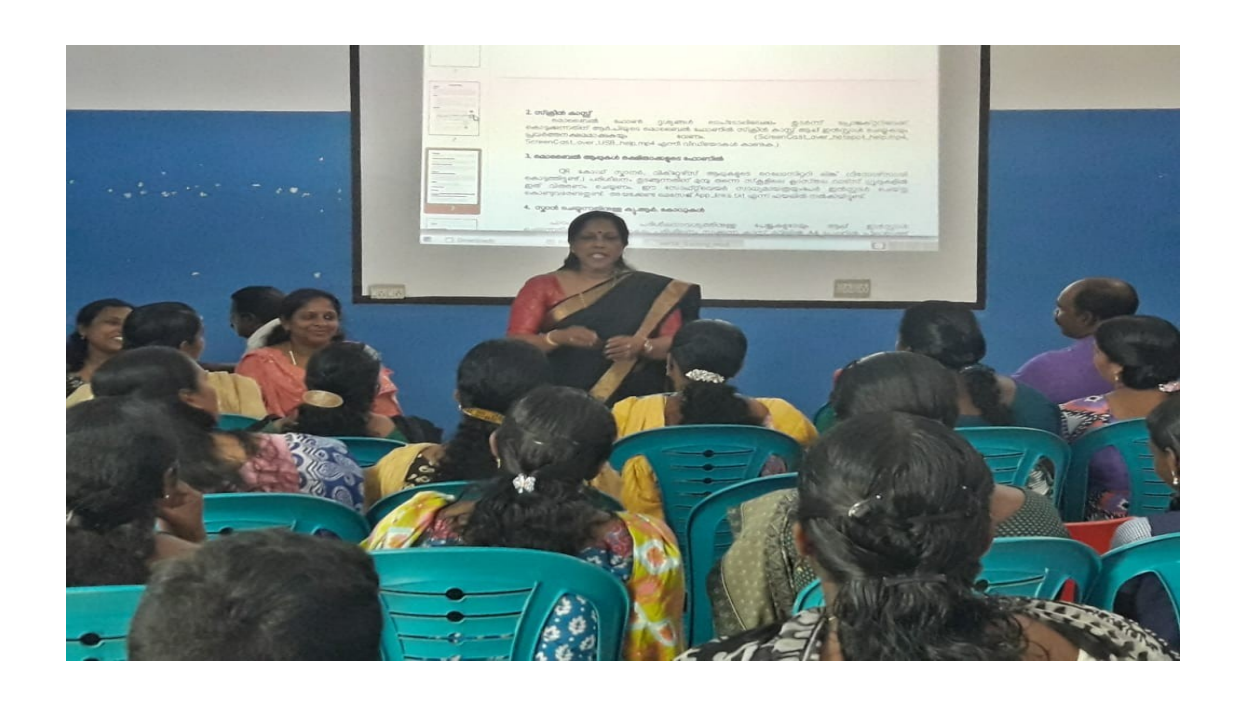
little kites school camp conducted for parents