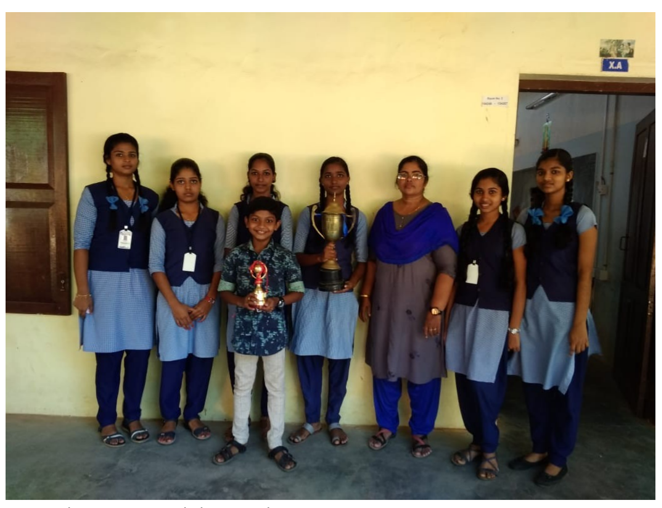
music competition winners