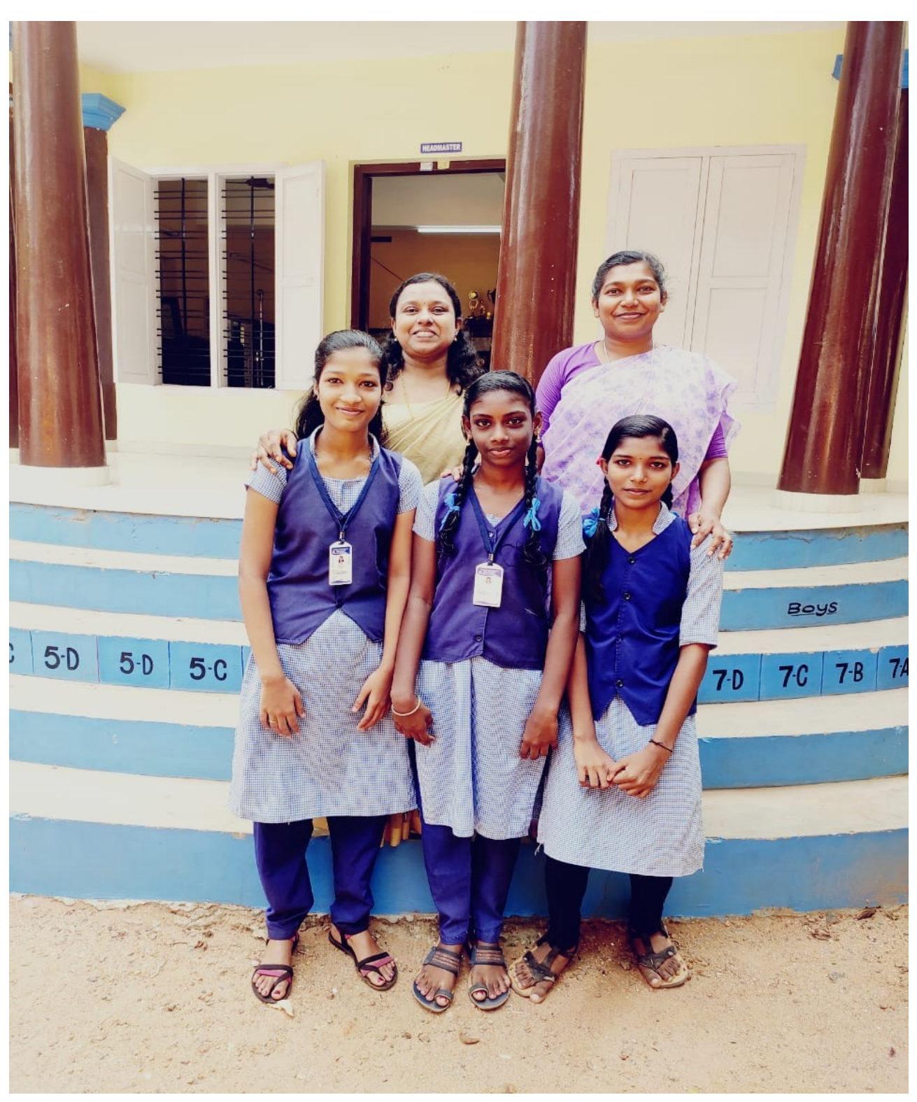
SNEHA, ANSY, SNEHA