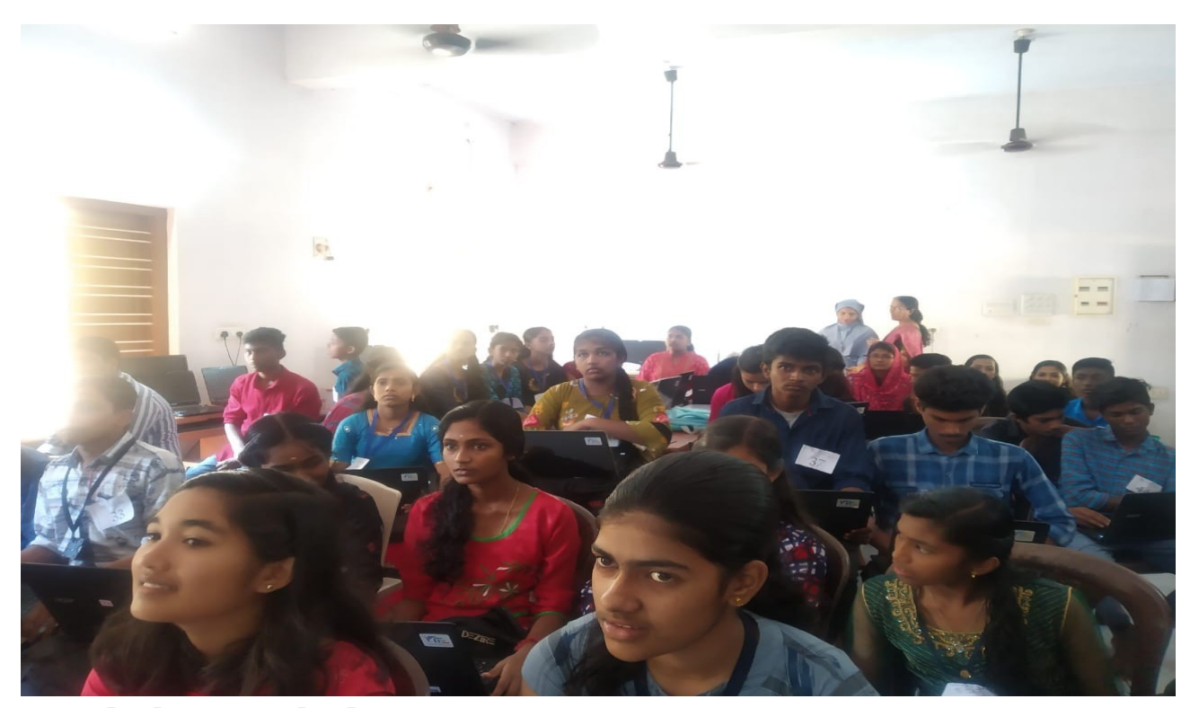
Little kites sub district camp