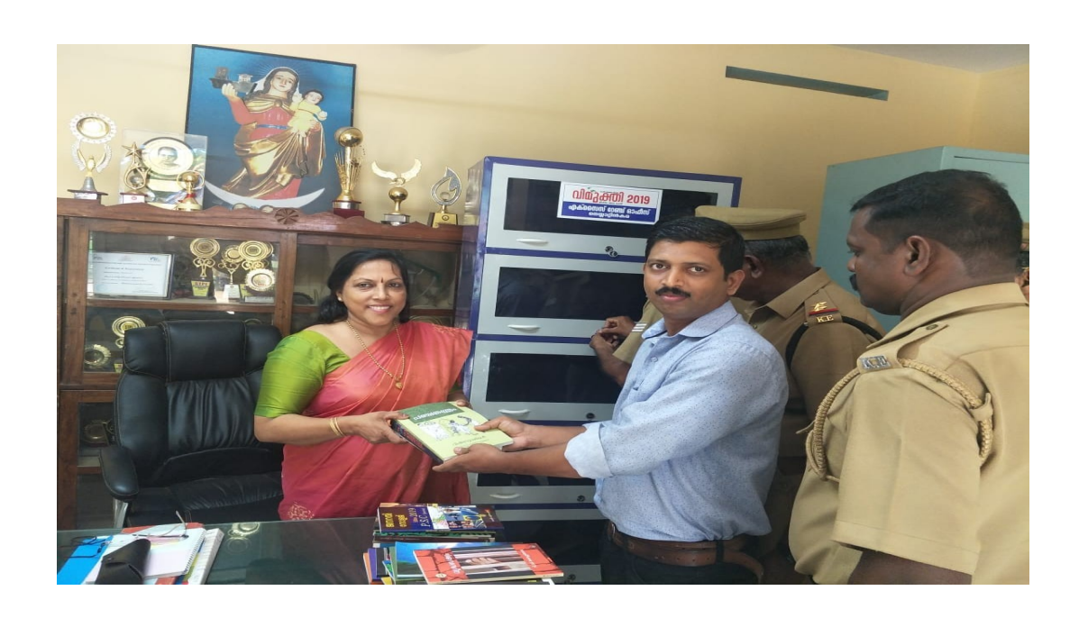
Books sponsoring by Vizhinjam police officers in READING day