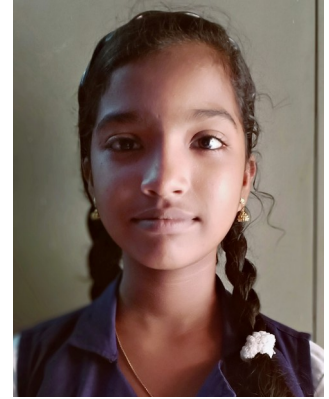
ശ്രോദ എസ് ലാൽ 7B

ഹാ ചിരിക്കുന്ന പൂവേ തരികില്ലേ ഇത്തിരി ശോഭ എത്രയോ ചിരിക്കുന്ന പൂക്കൾ ഉണ്ടായിരുന്നു മലയാളമണ്ണിൽ .