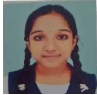
GADHA.S IX B

ഏതോ സ്വപ്നം വിടരുംപോലെ എൻ മനം തുടിച്ചു പൂവിരിയുപോലെ എന്നിൽ മന്ദഹാസം വിടർന്നു.