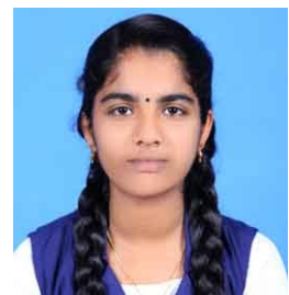
ശ്രദ്ധ എസ് ലാൽ

നമുക്ക് എല്ലാവർക്കുംസുപരിചിതമാണല്ലോ കാടിന്റെ മകനായ മധു എന്ന യുവാവിനെ . ഒരു നേരത്തെ വിശപ്പ് അകറ്റുന്നതിനായി അല്പം ഭക്ഷണം മോഷ്ടിച്ചെന്ന പേരിൽ തെരുവുപട്ടിക്ക് സമാനമായിക്കണ്ടു ആ പാവം മനുഷ്യനെ മാംസപിണ്ഡത്തിന്റെ അവസ്ഥയിലാക്കി , എന്താണിത് ? എത്രമാത്രം ഭക്ഷണമാണ് നാം ഓരോരുത്തരും നിത്യേന പാഴാക്കിക്കളയുന്നത് . പരിഷ്കാരത്തിന്റെ ഉച്ചസൂര്യൻ തലക്കുമീതെ ഉദിച്ചുനിൽക്കുമ്പോഴും നമ്മുടെ സമൂഹം അന്ധകാരത്തിലേക്ക് ആഴ്ന്നുകൊണ്ടിരിക്കുകയാണ്. എന്താണ് ജനങ്ങൾ ചിന്തിക്കുന്നത് ? ഭക്ഷണം എടുത്തപേരിൽ ആ യുവാവിന് ശിക്ഷനൽകാൻ നിയമം കയ്യിലെടുക്കാൻമാത്രം അവർ എങ്ങനെ ധൈര്യം കാട്ടി ? അവർ സ്വയം നിയമപാലകർ ആകുകയായിരുന്നോ? അങ്ങനെ എങ്കിൽ പിന്നെ എന്തിനാണ് നിയമവും കോടതിയയും പോലീസുമൊക്കെ. ആ സാധു മനുഷ്യന്റെ അമ്മയുടെയും സഹോദരങ്ങളുടെയും കണ്ണുനീരിനു പകരമായി അവർക്ക് എന്ത് നൽകി ആശ്വസിപ്പിക്കാൻ സാധിക്കും. ആ മകന്റെ കുറവ് നികത്തുവാൻ അവരെക്കൊണ്ടു സാധിക്കുമോ? പണത്തിനു പുറകെനടന്നു കണ്ണ് മഞ്ഞളിച്ചു പോയ , സ്വാർത്ഥമതിയായ മനുഷ്യന്റെ മനസ്സും ചെയ്തികളുമാണ് മധുവിന്റെ മരണത്തിനു കാരണം .മാറേണ്ടത് നമ്മൾ അല്പ മരിച്ചു നമ്മുടെ കാഴ്ചപ്പാടാണ്. കണ്ണുള്ളവർ കാണട്ടെ , കാതുളളവർ കേൾക്കട്ടെ നാവുള്ളവർ പറയട്ടെ മധു എന്ന കാടിന്റെ മകന്റെ കഥ.