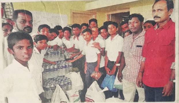
കുട്ടനാട്ടിലെ ബള്ളപ്പെക്കുന്നിൽ ദുരിതമനുഭവിക്കുന്നവർക്കായി ചെറിയഴിക്കൽ ജി.വി.എൽ.പി.എസ്. നന്മ ക്ലബ്ബ് സഹായകമായി സഹായം അർപ്പിച്ചു.

കുട്ടനാട്ടിലെ ബള്ളപ്പെക്കുന്നിൽ ദുരിതമനുഭവിക്കുന്നവർക്ക് ചെറിയഴിക്കൽ ജി.വി.എൽ.പി.എസ്. നന്മ ക്ലബ്ബ് സഹായകമായി സഹായം അർപ്പിച്ചു. ഈ ക്ലബ്ബ് സഹായകമായി സഹായം അർപ്പിച്ചു. ഈ ക്ലബ്ബ് സഹായകമായി സഹായം അർപ്പിച്ചു.