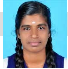
DEVANANDA R X B