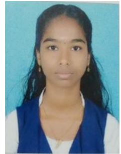
MEENU. 9 A