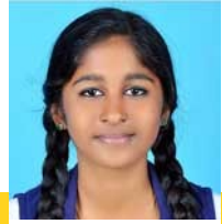
INDUPRIYA. A X B