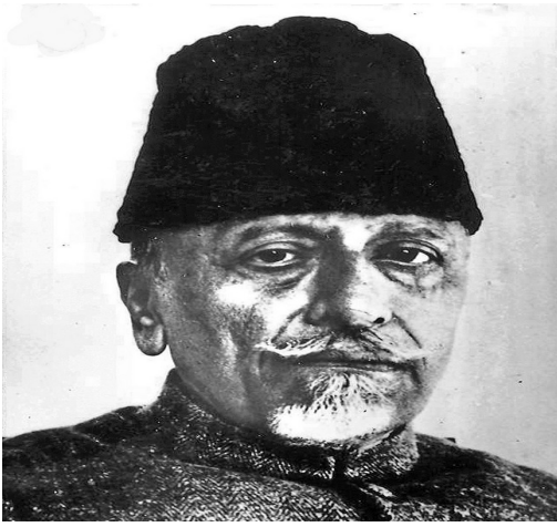
مولانا ابوالکلام آزاد (۱۸۸۸-۱۹۵۸)