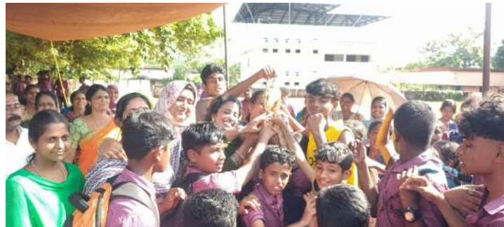
SPORDS DAY CELIBRATION