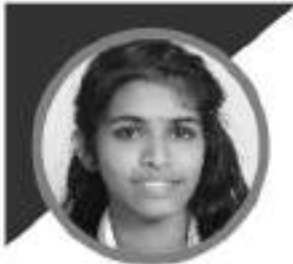
പ്രവിദ്യ ആബേൽ +1