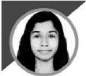
ശ്രീവതനന 10 B