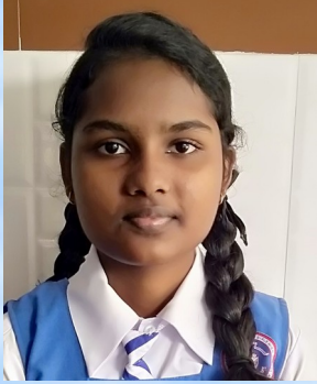
സ്റ്റേജ് വി.എസ് VIII

ഒരിക്കലും തിരിച്ചുവരില്ലാത്തൊരൻ ബാല്യകാലത്തെക്കുറിച്ചോർക്കുന്നു ഞാൻ എന്തുരസമാണാക്കാലം എന്തെ- പുളകോന്മാദനാക്കുന്ന കാലം. അമ്മയുടെ സാരിത്തുമ്പിൽ പറ്റി- പിടിച്ചൊരു കൊച്ചുപുസ്തകങ്ങളെ നടന്നക്കാലം. വികൃതികൾ തകൃതിയായ് കാണിച്ചൊരുങ്ങി- ക്കണ്ണനായ് വിലസിനടന്നകാലം.