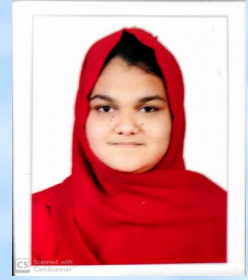
Bisharath VIII A

Parents are the backbone of our life They are God's gift We can't see God But, we can see God in our parents