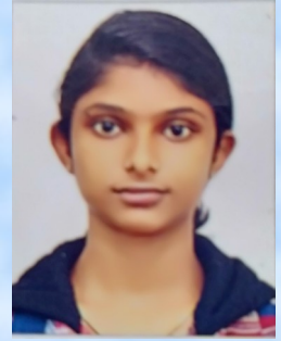
ദാനിയ സുസൻ VIII

ഒരിടത്ത് ഒരിടത്ത് ഒരു നരി ഉണ്ടായിരുന്നു. അവൻ വളരെ ബുദ്ധിശാലിയായിരുന്നു. അവൻ കാട്ടിലൂടെ നടന്നുപോകുമ്പോൾ ചത്ത് കിടക്കുന്ന ഒരു ആനയെ കണ്ടു .അവൻ മെല്ലെ അടുത്തുചെന്ന് കടുച്ചുകിറാൻ തുടങ്ങി. എന്നാൽ ആനയുടെ ശരീരത്തിൽ നല്ല കട്ടിയുള്ള തോലായിരുന്നു അതിനാൽ നരിക്ക് ആനയെ ഭക്ഷിക്കാനായില്ല. അപ്പോൾ അതുവഴി ഒരു സിംഹം വരുന്നുണ്ടായിരുന്നു. നരി സിംഹത്തോട്: "സിംഹരാജാവേ ഞാൻ നിങ്ങൾക്കായ് കൊണ്ടുവന്നത് ഭക്ഷിച്ചാലും". സിംഹം: "നിനക്കറിഞ്ഞുകൂടെ ? മറ്റു മൃഗങ്ങൾ കൊല്ലുന്നതിനെയൊന്നും ഞാൻ കഴിക്കുകയില്ല എന്ന്". സിംഹം ആനയുടെ ഉടൽ കഴിക്കാതെ പോയത് നരിക്ക് വിഷമമായി.