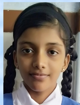
ആലിയ ആർ VII A

കാട്ടിലെ കിളികൾക്കു മരം വേണം നാട്ടിലെ മനുഷ്യർക്കു മരം വേണം പറക്കുന്ന തുമ്പിക്കടും ചിരിക്കുന്ന കുഞ്ഞിനും മരിക്കുന്ന വൃദ്ധനും മരം വേണം ശ്വസിക്കുവാൻ പ്രാണനായ് മരം വേണം കുടിക്കുവാൻ ജലമായി മരം വേണം വിശപ്പിനു പഴംകിട്ടാൻ മരം വേണം കണ്ണിനു കുളിരായി മരം വേണം ഞങ്ങൾക്കു തുണയായി മരം വേണം വെട്ടല്ലേ വെട്ടല്ലേ വലിയോരെ വിറ്റു കാശാക്കല്ലേ പെരിയോരെ മരമിതു ഞങ്ങൾക്കും തണലാണേ തണലുമുടിക്കൊല്ലേ ഉടയോരെ!