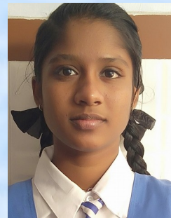
ലയാ ഷാജി X C

ഉപേക്ഷിച്ച ട്രെയിനിലേക്ക് കയറി ട്രെയിൻ മുന്നോട്ട് നിങ്ങളുടങ്ങിയപ്പോഴും എന്റെ കണ്ണിൽ നിന്നും കാലിൽ നിറഞ്ഞുകിടക്കുന്ന കൊല്ലസുകളിട്ട് ഓടിനടക്കുന്ന കൊല്ലസിന്റെ മുഖം മായാതെ .ആ നാടിനോട് യാത്രപറഞ്ഞുനീങ്ങി..