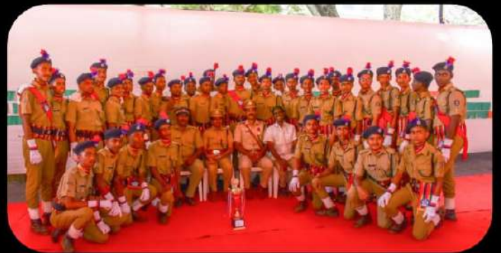
ജില്ലാ റിപ്പബ്ലിക് പരേഡ് -2nd