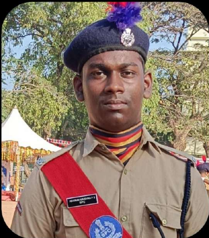
അഭിനവ് കുഷ്ണ പി എസ് സ്റ്റേറ്റ് എസ് പി സി ക്യാമ്പ് 2024