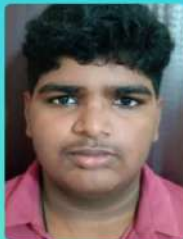
VASUDEV (9B) ANIMATION