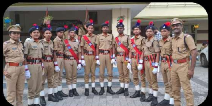
ജില്ലാ എസ് പി സി ക്യാമ്പ് 2024