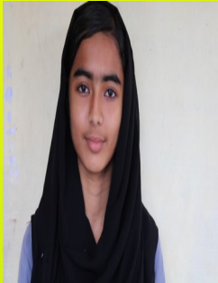
സുഫിലി.എസ് IX A