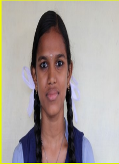
ശോവിക.വി IX A