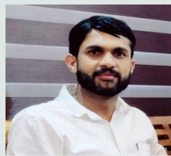
ഹാരിസ് മാസ്റ്റർ (ലിറ്റിൽ കൈറ്റ് മാസ്റ്റർ)