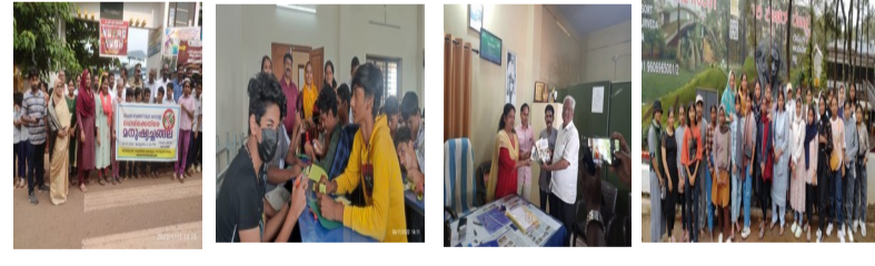
ഓട്ടോ ഗാലറി - 1. ലഹരി വിരുദ്ധ മരുന്നുകളുടെ 2. ജെ ആർ സി സഹവാസ ക്യാമ്പ് 3. പുസ്തക സദാഭാവന 4. പഠനയാത്ര