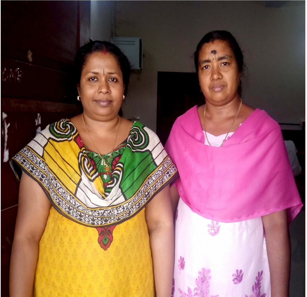
കൈറ്റമിസ്‌ട്രസ് പ്രിത. പി. ആർ, രേഖാരാജ്