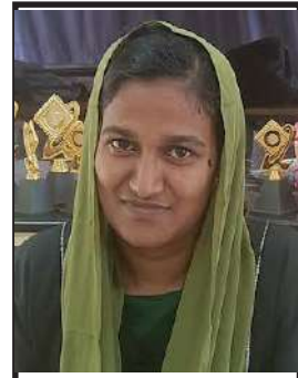
അൻസില MPTA പ്രസിഡന്റ്