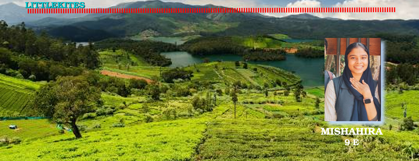
MISHAHIRA 9 E