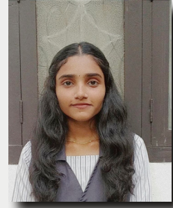
HIDANYA P 9 B