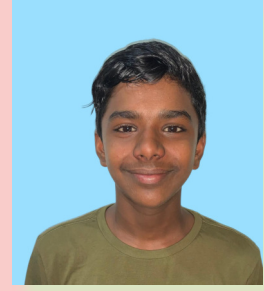
NIJAD 8 A