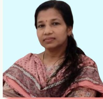
SHINI D LITTLEKITES MISTRESS