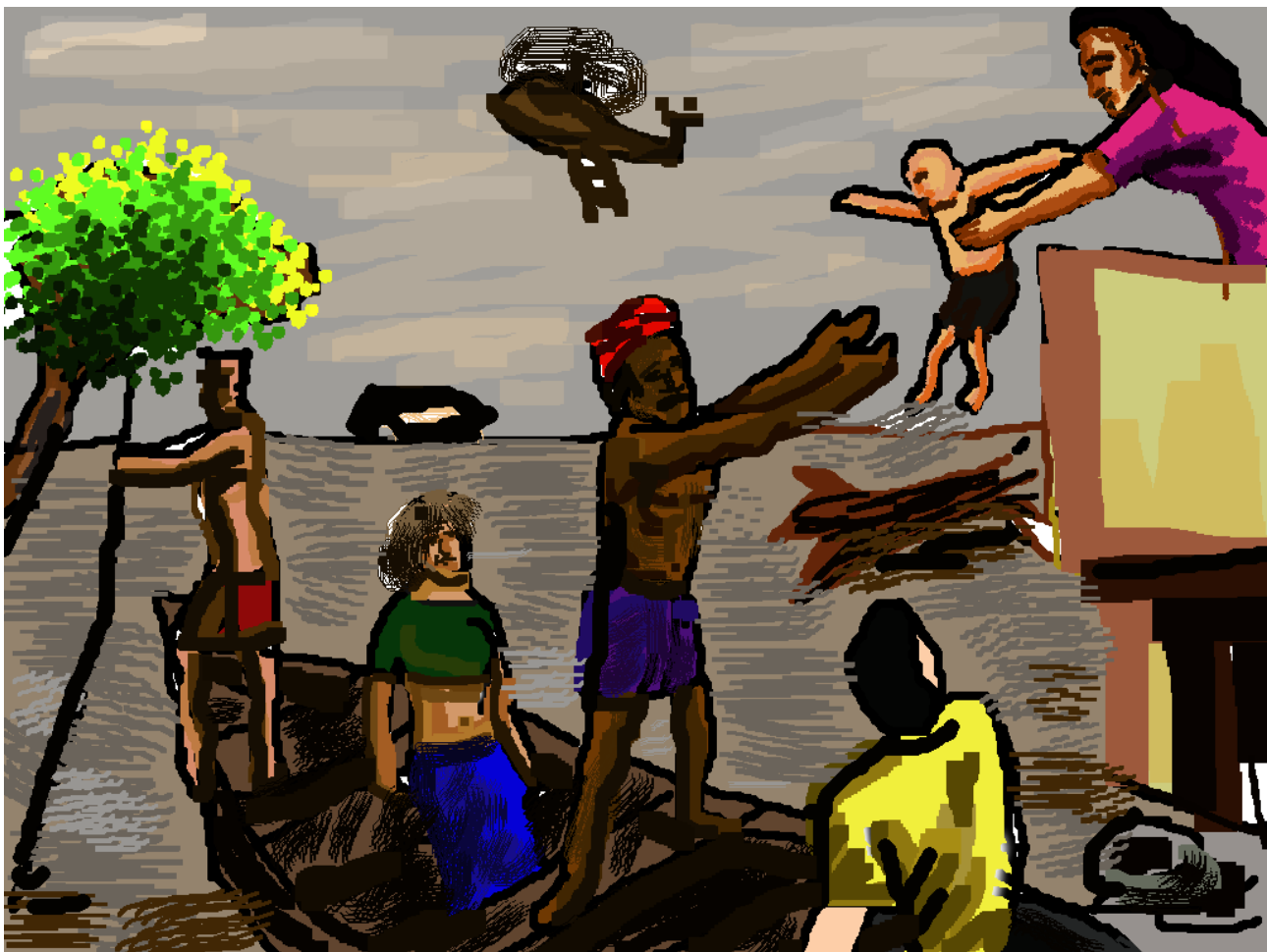
വരച്ചത് മാസ്റ്റർ ശ്രാവൺ ചന്ദ്രൻ 10B