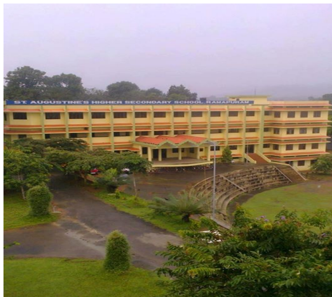
Augustine's little kites